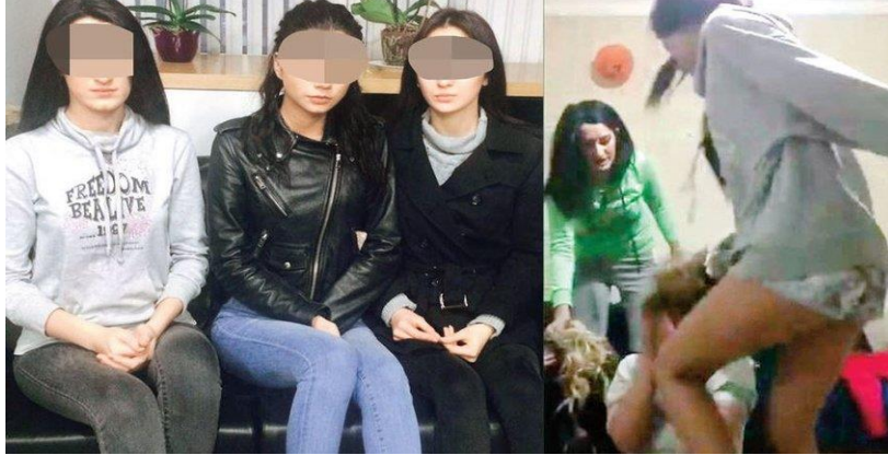
Şekil 1.Trabzon'da hemcinslerini darp eden öğrenciler ve kavga anından bir görsel

leme ve eylemin suça dönüşmesine işaret eder. Toplumsal cinsiyet bağlamında kadın sorununa dair alanyazındaki boşluğu doldurma gayretinin bir ürünüdür.