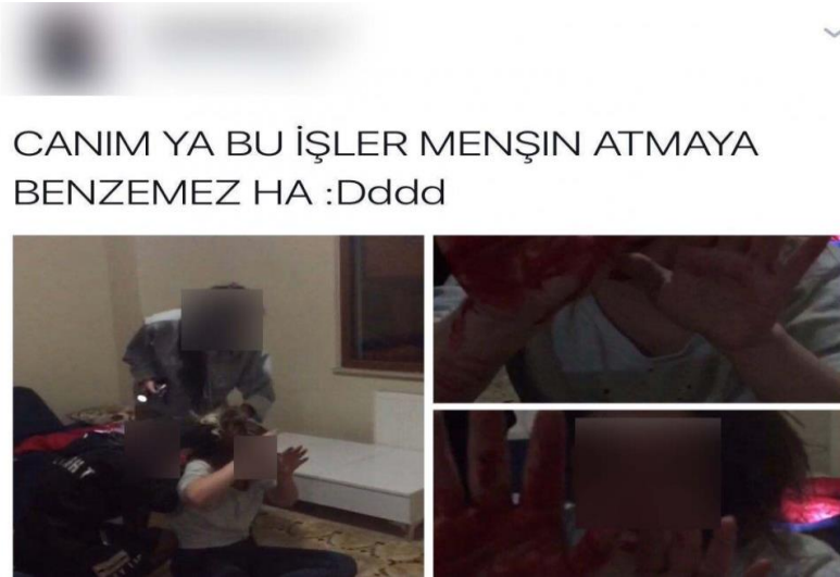
Şekil 2.Kavga sonrası darp eden öğrencilerden birinin sosyal medya hesabından yaptığı paylaşım.