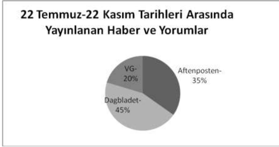
Grafik 1: 22 Temmuz-22 Kasım Tarihleri Arasındaki Haber ve Yorum Dağılımı

Manşetlere ilişkin içerik analizinin gerçekleştirildiği ilk haftaya ilişkin verilere göre toplam 418 haber ve yorum saptanmıştır. Olayın ilk haftasındaki toplam haber ve yorum yazılarının yarısı tabloid bir gazete olan Dagbladet'te yer alırken, üçte birinin Aftenposten'da diğer yandan, en az oranda haber veya yorumun VG'de yer aldığı (% 13) saptanmıştır. Olayın ilk dört ayına ilişkin yazıların gazetelere göre dağılımının ilk haftadaki dağılımla benzer özellikler gösterdiği gözlenmiş ve her iki zaman aralığında da en fazla sayıda yazı birimi tabloid gazete olan Dagbladet'te, en az yazı ise araştırmancının diğer tabloid gazetesi olan VG'de yer aldığı ortaya konmuştur (Grafik 2). Bu sonuçlara göre, Norveç basının Breivik olayı karşısında, tabloid basın-ciddi basına özgü haber yapma alışkanlıkları yerine, haber yapım sürecinde ağırlıklı olarak editoryal kararlar olarak bir yayın politikası belirlediği gözlenmiştir.