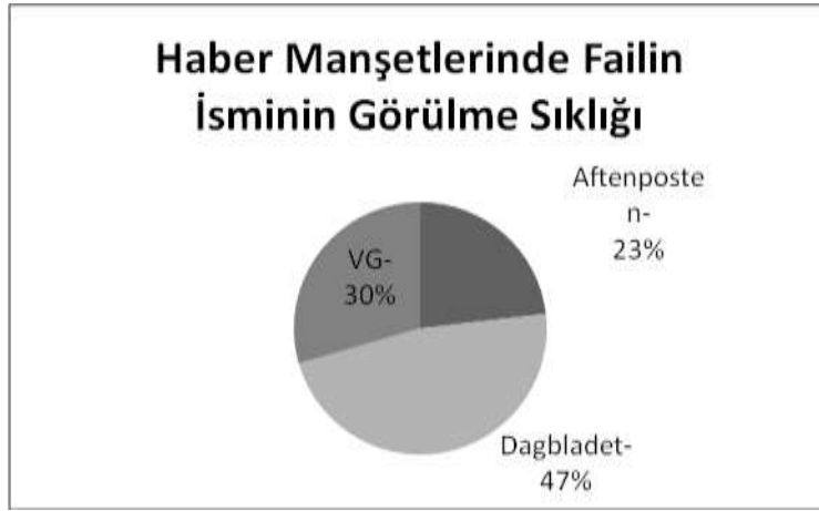
Grafik 3. Haber Manşetlerinde Failin Adının Görülme Sıklığı

Norveç tarihindeki en dramatik/travmatik terör olayına ilişkin haber manşetlerinin objektif veya sübjektif yargılar içermesi niteliksel bir analiz değişkeni olarak gazetecilerin olaya ilişkin yaklaşımını ve gazetenin editoryal kararını yansıtmaya bakımdan önemli bir değişkendir. Bu araştırma çerçevesinde her üç gazete de saptanan toplam 294 objektif yargı içeren manşete karşılık, 125 sübjektif yargı içeren manşet kullanıldığı belirlenmiştir. Bu analiz çerçevesinde en yüksek oranda objektif manşete, olaya en çok yer ayıran Dagbladet gazetesinde (% 45) saptanırken, % 36 oranında objektif manşet Aftenposten'da, % 18 oranında da VG'de rastlanmıştır (Grafik 4).